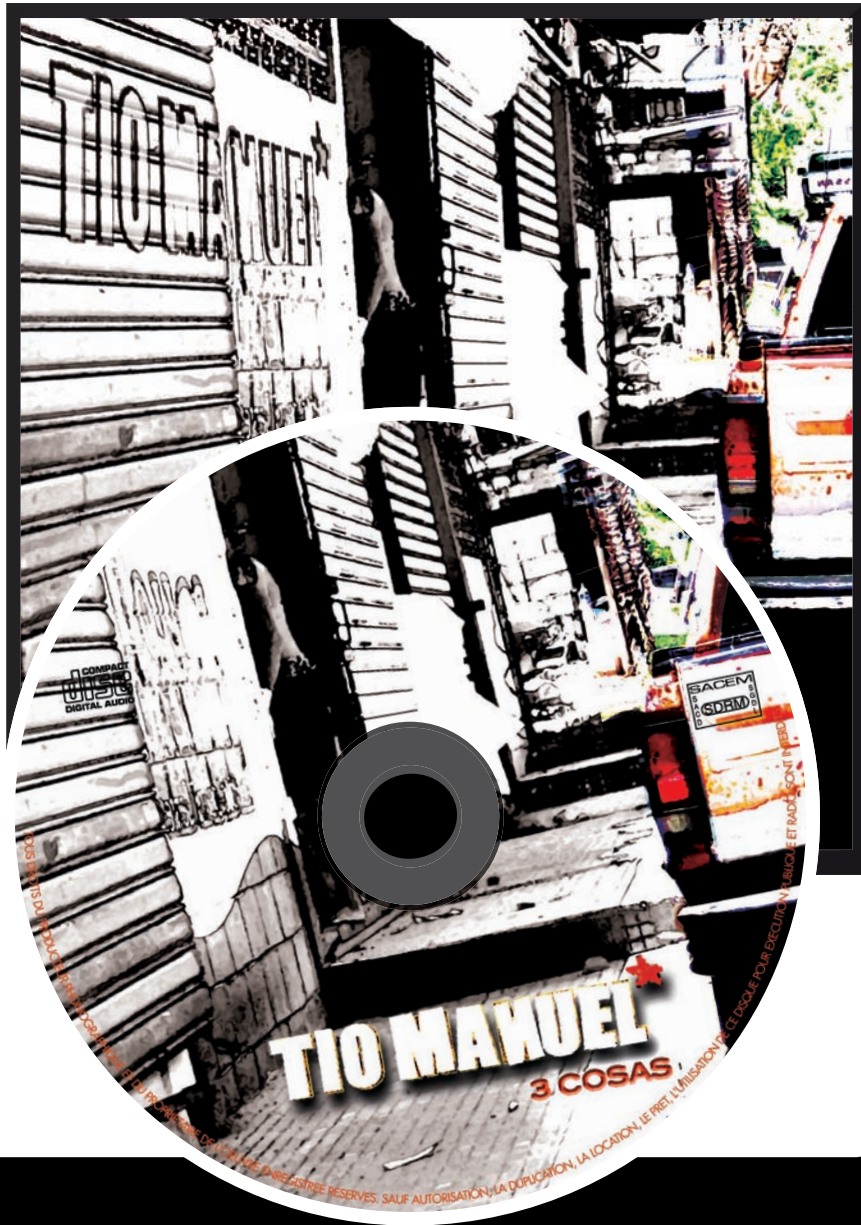
3è album de Tio Manuel : jaquette cD livret